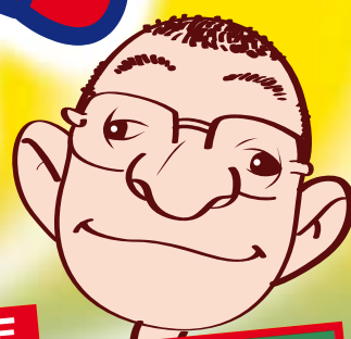
LE TABLEAU MAGIQUE

un nouveau jeu qui permet à 100% des joueurs de gagner un lot